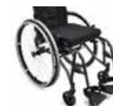
Reguliuojamas pakajo aukštis