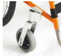
Priekiniai ratukai - stabilumui

XLT Swing – su nusukamais pakojais ir dvejomis pėdų plokštelėmis.