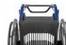
Tvirta karboninė sėdėjimo plokštuma su režiais idealiam balansui.