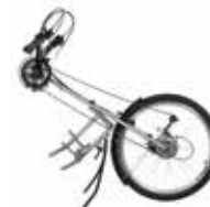
Reguliuojamas varytuvo aukštis, ilgis bei pasvirimo kampas

„Versatio“ lotynų kalboje reiškia – revoliucija. Šiuo atveju revoliucija yra rankinio dviračio SPEEDY Versatio „Neodrives“ pavarų sistema, kuri palengvina judėjimą ir suteikia komfortą važiuojant rankiniu dviračiu. Dabar kiekvienas, net ir silpnas rankas turintis žmogus gali važiuoti rankiniu dviračiu. Net 80% sumažintas vežimėlio pasipriešinimas ir mažai jėgų reikalaujantis valdymas. Tinka ir gali būti montuojamas ant visų standartinių neįgaliųjų vežimėlių. Veikia nuo įkraunamos ilgai veikiančios ličio jonų baterijos, sumontuotos ant rankinio dviračio. Ypač lengvas, paprastas ir saugus naudojimas.