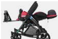
Pilnai atsilenkianti vežimėlio nugarėlė