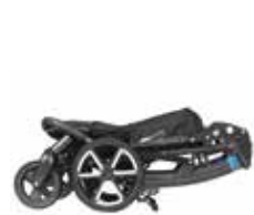
Kompaktiškai sulankstomas, patogus laikyti namuose ir keliauti