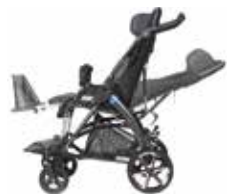
Pilnai atsilenkiantį vežimėlio nugarėlę.