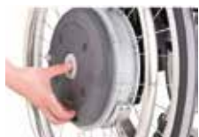
Lengvai numontuojami nuo vežimėlio

Judėjimą palengvinantys elektriniai ratai, tinkantys ir montuojami ant visų standartinių neįgaliųjų vežimėlių. Veikia nuo įkraunamų ilgai veikiančių ličio baterijų, montuojamų vežimėlio ratuose. Ypač lengvas, paprastas, saugus naudojimas net ir silpnas rankas turintiems vežimėlių naudotojams.