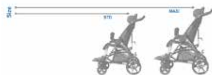
Galimi du dydžiai: STD ir MAXI