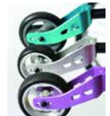
Ratukų spalvų pasirinkimas