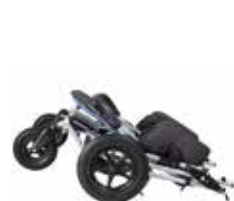
Kompaktiškai sulankstomas, patogus laikyti namuose ir keliauti