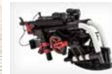
Mažiausias sulankstytas vežimėlis pasaulyje