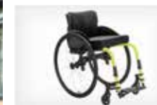
Tvirtas sulankstomas vežimėlis

Kai jūs pirmą kartą išbandysite Champion , jūs pajusite, kad nieko panašaus anksčiau neturėjote. Idealus partneris kelionėse. KUSCHALL Champion yra suglaudžiamo rėmo vežimėlis, kuris sulankstytas yra mažiausias pasaulyje! Jis sulankstomas per 3 paprastus žingsnius – suglaudus vežimėlio rėmą ir į priekį nulenkus nugaros atramą, lieka tik sulenkta priekinė rėmą, t.y. pakojį perlenkti pusiau.