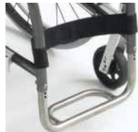
Pakojis iš titano – komfortui ir lengvumui