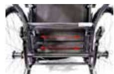
Velcro diržai padeda lengviau sureguliuoti sėdynės aukštį