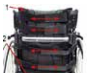
Galite susireguliuoti nugarėlės įtempimą diržais