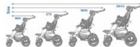
Galimi 4 dydžiai: MINI, STD, MAXI, SM 42