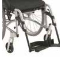
XLT Swing su nusukamais pakojais ir dvejomis pėdų plokštelėmis.