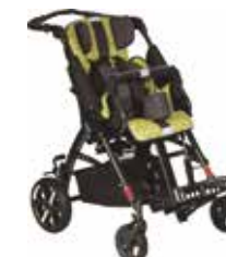
Vežimėlis turi perstatomą kėdutę, tad vaikas gali žiūrėti į aplinką arba į stumiantįjį