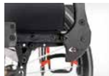
Galinis rėmas su išpaustytu logo ženklu