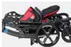
Kompaktiškai sulankstomas, patogus laikyti namuose ir keliauti

Vežimėlis su nauja važiuoklės ir sėdynės jungtimi, saugia stabdžių sistema, spyruokline pakaba, sulaikančia smūgius. Ergonomiška, reguliuojamo aukščio stūmimo rankena. Sėdynė nuimama, reguliuojamo dydžio, padėties, su nuimamu paminkštintu užvalkalu ir lanksčia fiksavimo ir pozicionavimo priedų tvirtinimo sistema. Rėmas sulankstomas nenuėmus sėdynės. TOM 5 Streeter vežimėlis turi perstatomą kėdutę, kurios dėka stumiant vežimėlį vaikas gali žiūrėti važiavimo kryptimi arba į stumiantįjį.