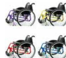
Vežimėlio rėmo spalvų įvairovė