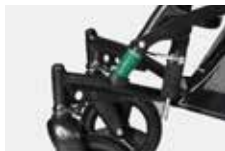
Spyruoklinė pakaba puikiai sulaiko smūgius ir suteikia komfortą