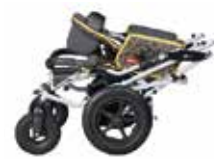
Kompaktiškai sulankstomas, patogus laikyti namuose ir keliauti

Tom 4 Classic palydovo valdomas vežimėlis. Sulankstomas rėmas yra pagamintas iš plonasiėnių vamzdelių. Rėmas gali būti sulankstomas net nenuėmus sėdynės. Dydis augantis kartu su vaiku.