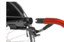
Greitas ir lengvas priekinio rėmo bei ratų nuėmimas