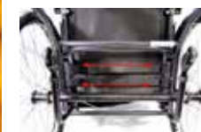
Velcro diržai padeda lengviau sureguliuoti sėdynės aukštį