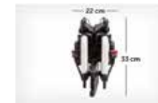
Sulankstyto vežimėlio vaizdas iš priekio