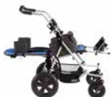
Pilnai atsilenkianti vežimėlio nugarėlė