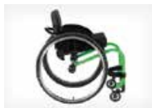
LENGVUMAS IR MANEVINGUMAS