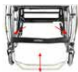
Reguliuojamas pakajo aukštis