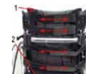
Galite susireguliuoti nugarėlės įtempimą diržais