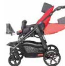
Pilnai atsilenkianti vežimėlio nugarėlė