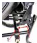
Galite lengvai sureguliuoti vežimėlio balansą pastumdami vežimėlio ašį