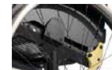
Viskas sumontuota sėdynės modulyje