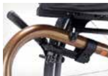
Reguliuojamas sėdėjimo aukštis