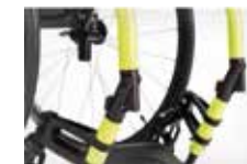
Pasirenkamas sulankstomas priekinis rėmas (+480 g)