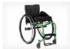
NERIBOTOS PASIRINKIMO GALIMYBĖS.

K-Series vežimėlis – sukurtas visiškai laisvei. Jis yra gavęs apdovanojimą už novatorišką dizainą, tinkantį labai aktyviems žmonėms, norintiems estetiškos išvaizdos taip pat kaip ir išskirtinio stiprumo ir efektyvumo. Kuschall® K-Series modelio nesuglaudžiamo rėmo vežimėliai tinka net ir patiems ekstremaliausiems vartotojams. Tvirtas ir kompaktiškas. Šis vežimėlis skirtas tam, kuris nori unikalaus vežimėlio kasdieniam naudojimui.