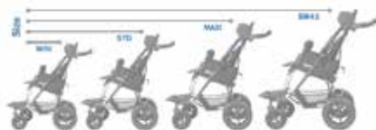
Galimi 4 dydžiai: MINI, STD, MAXI, SM42