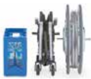
Lengva numontuoti, patogų transportuoti