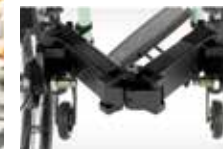
Unikalus horizontalus sulankstymo mechanizmas