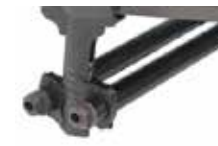
Papildoma antroji ašis stabilumui