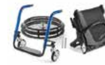
Kompaktiškas ir lengvas transportavimas