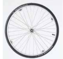
Standartiniai ratai su juodomis Marathon Evolution Plus padangomis