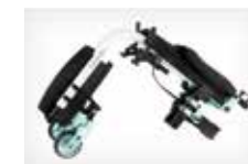
Transportavimo dydis su standartiniu priekiniu rėmu