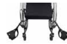
Lengvai nusukami pakojai