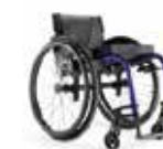
Pajusk kažką naujo!