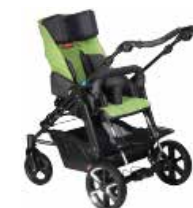
Vežimėlis turi perstatomą kėdutę, tad vaikas gali žiūrėti į aplinką arba į stumiantįjį