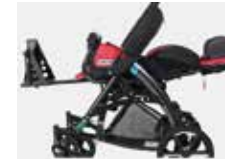
Pilnai atsilenkianti vežimėlio nugarėlė