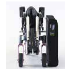
Įtin kompaktiškai sulankstomas

Action 5 yra inovatyvaus dizaino aktyvaus tipo vežimėlis. Lengva konstrukcija, sulankstomas rėmas ir žemyn nulenkiama nugaros atrama leidžia vežimėlį lengvai transportuoti ar perkelti. Patentuotas H formos horizontalus sulankstymo mechanizmas suteikia patobulintą stabilumo lygį. Savaiminio blokavimo funkcija užtikrina saugią sėdėjimo padėtį ir padaro vežimėlį dar lengviau riedančiu. Lengvas ir įvairus pritaikymas kiekvieno naudotojo patogumui. Nugaros atramos kampas gali būti reguliuojamas naudotojui sėdint vežimėlyje.