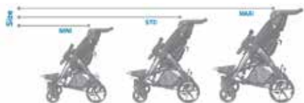
Galimi 3 dydžiai: MINI, STD, MAXI