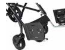
Yra galimybė pasirinkti atskirus nusukamus pakojus