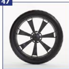
Pilnaviduriai galiniai ratai, 7 stipinų