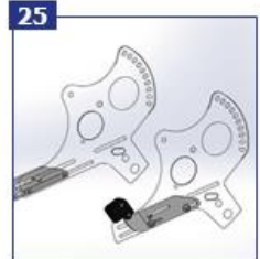
25 Laikiklis priedams