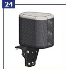
24 Abdukcijos blokas, fiksuotas