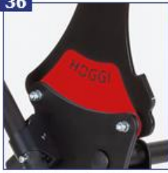
Šoniniai dangteliai, užvalkalų spalvos