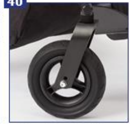
Aliuminės priekinių ratų šakės