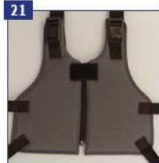
21 Fiksavimo liemenė