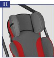
11 Galvos atramos pagalvėlės