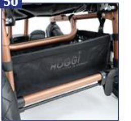
Minkštas priedų krepšys