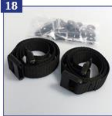
18 Pėdų diržai