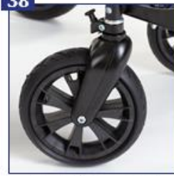
Plastikinės priekinių ratų šakės