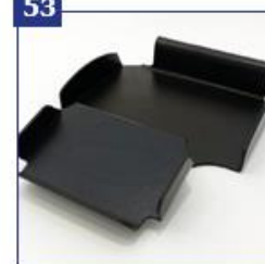
Papildomos įrangos dėklas