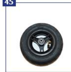
Pripučiami priekiniai ratai, būginių stabdžių