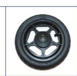
Pripučiami galiniai ratai, būginių stabdžių