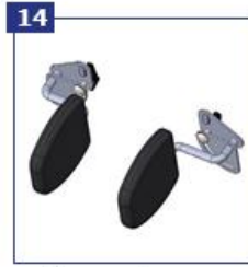
14 Liemens atramos