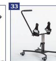
33 BASIC namų rėmas su 75 mm dvigubais ratukais