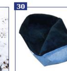
30 Avies vilnos įdėklas