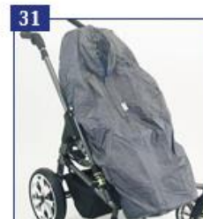
31 Lietaus uždangalas