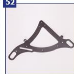
Supakavimo priedai pagal ISO 7176-19