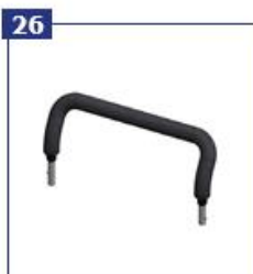
26 Laikymosi rankena su apmušalais