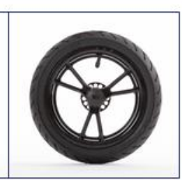
Pripučiami galiniai ratai