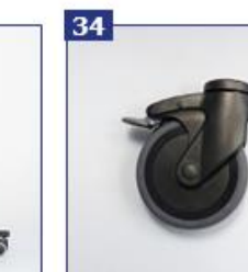
34 125 mm ratukai