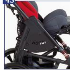
Šoniniai dangteliai, rėmo spalvos