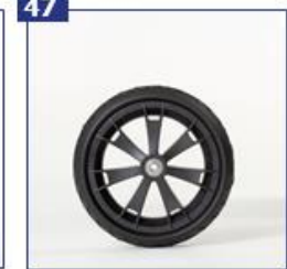
Pilnaviduriai priekiniai ratai, 7 stipinų