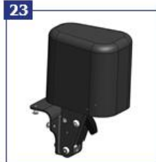
23 Abdukcijos blokas, atlenkiamas ir nuimamas