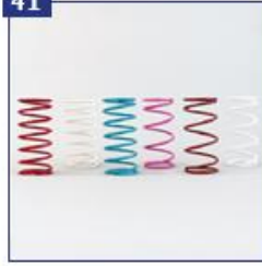
Rėmo pakabos sistema