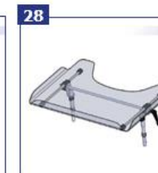
28 Terapinis stailis-padėklas, reguliuojamo aukščio