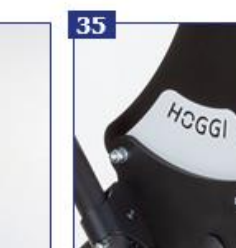
35 Šoniniai dangteliai, standartinės baltos spalvos