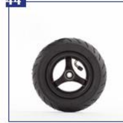
Pripučiami priekiniai ratai