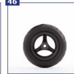
Pilnaviduriai priekiniai ratai