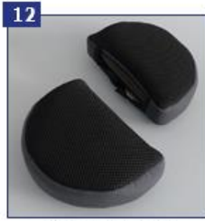
12 Galvos atramos pagalvėlės su tarpais garsiakalbiams