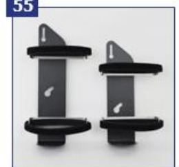
Reguliuojamo kampo deguonies baliono laikiklis