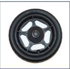
Pilnaviduriai galiniai ratai, būginių stabdžių