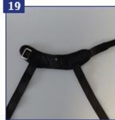
19 Čiurnos diržai