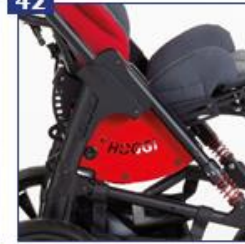
Šoniniai dangteliai, apmušalų spalvos