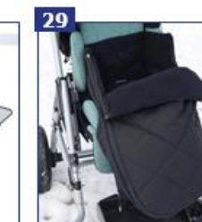
29 Žieminė apatinės kūno dalies mova