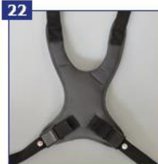
22 Krūtinės-pečių diržai