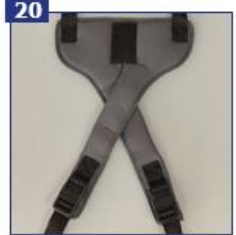
20 Kirkšnies diržas