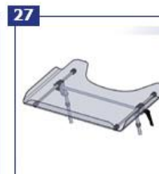
27 Terapinis stailis-padėklas