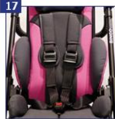
17 5 tvirtinimo taškų saugos diržai