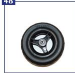
Pilnaviduriai priekiniai ratai, būginių stabdžių