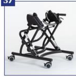
COBRA namų rėmas su 75 mm dvigubais ratukais