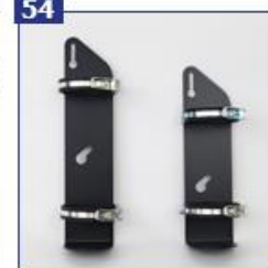
Deguonies baliono laikiklis