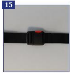
15 Juosmens diržas