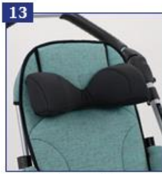
13 Anatominė kaklo ir galvos atrama