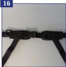
16 4 tvirtinimo taškų juosmens diržas